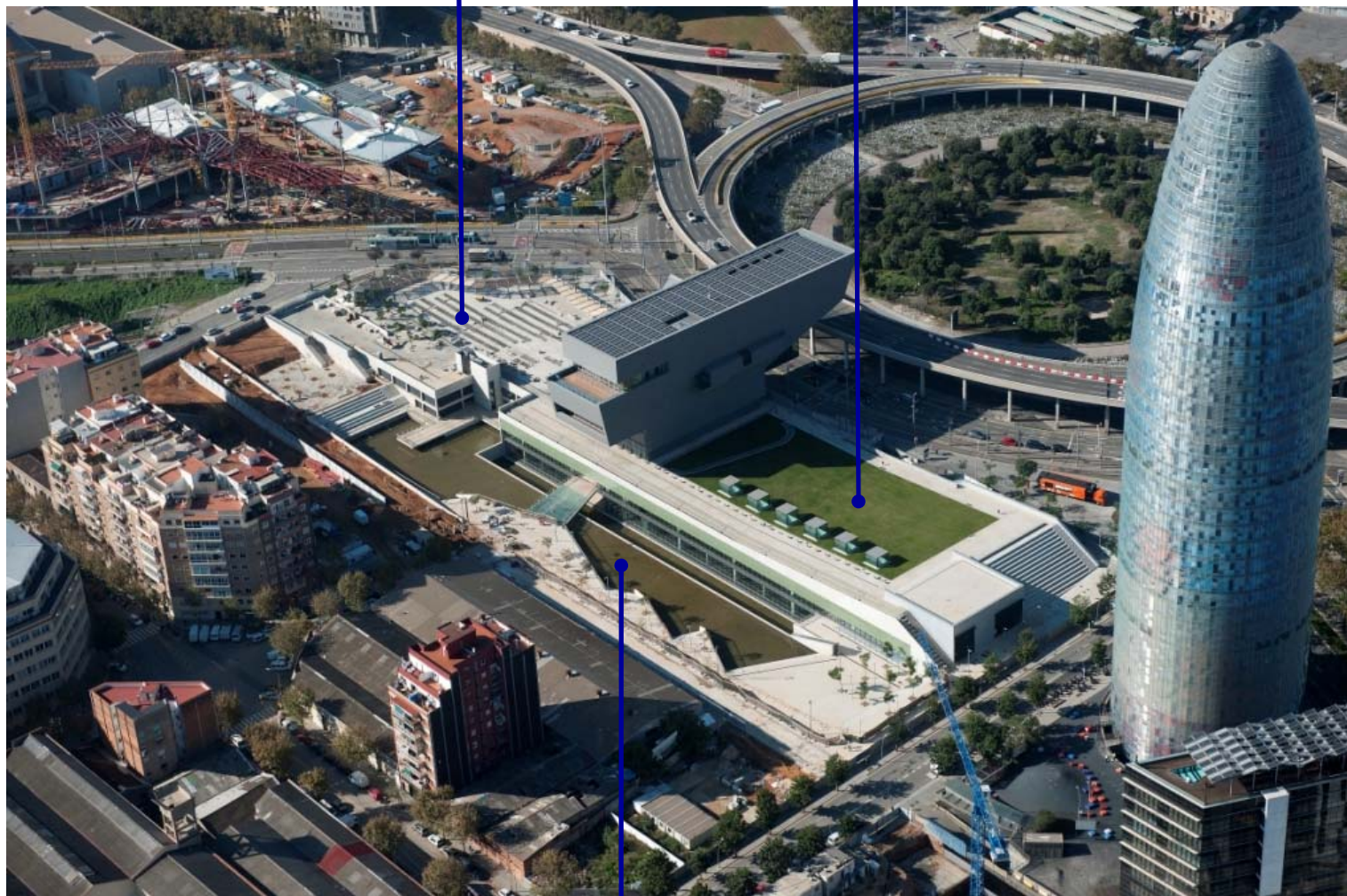
Fotografia de desembre de 2012