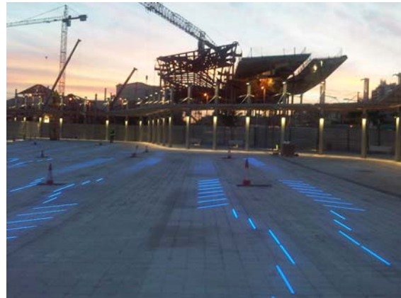
Zona de grafisme Iluminós