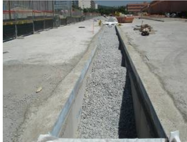
Reblert amb graves de la rasa drenant (17/06/09)