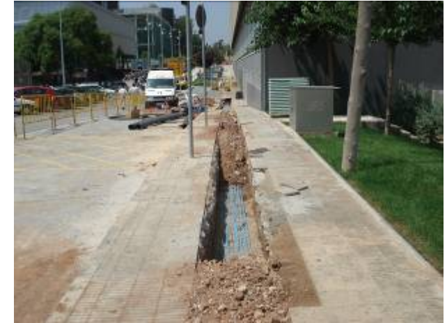
Rasa al costat Baldiri i Reixac (16/07/09)