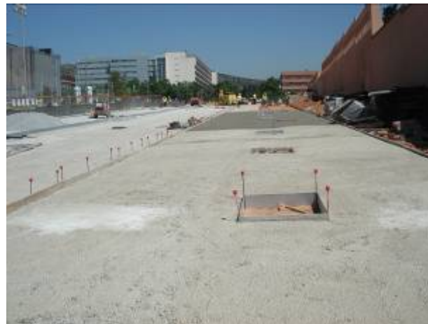
Formigonat i col·locació d'escocells a la vorera costat Besós (17/05/09)