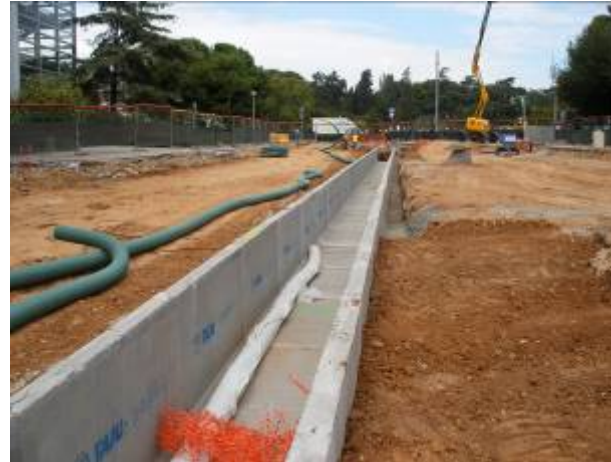
Treballs fase II c/Martí Franquès (17/09/09)