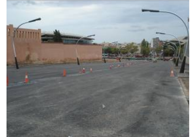
Treballs fase I c/Matí Franquès (15/09/09)