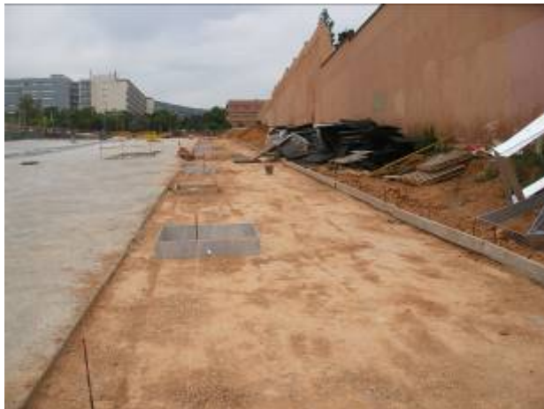
Replanteig d'escocells a vorera costat Besós (15/05/09)