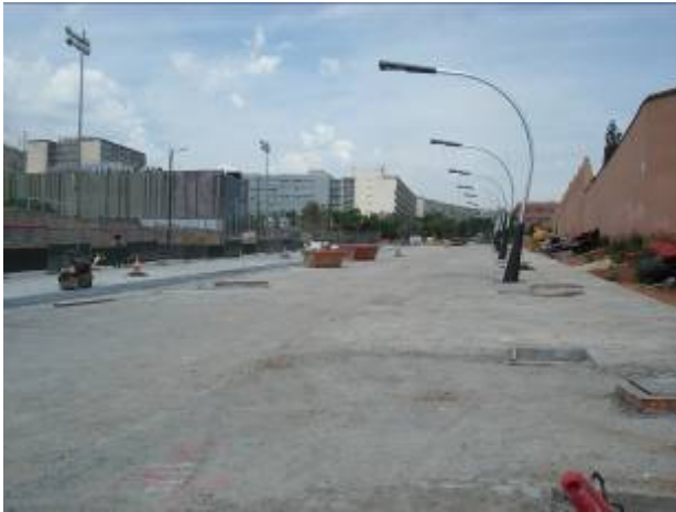
Col·locació de lluminàries costat Joan XXIII (02/07/09)