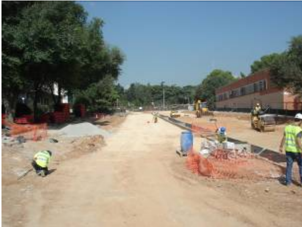
Execució fase II c/Pau Gargallo (01/10/09)