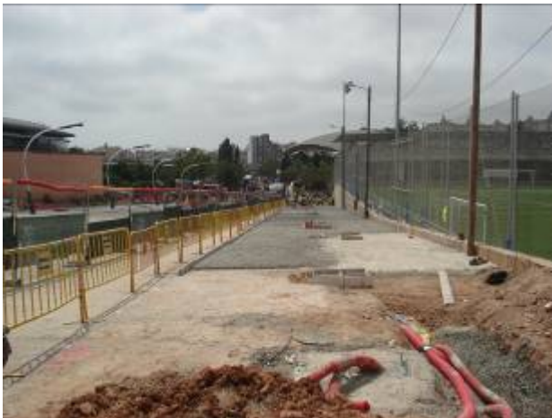
Formigonat al costat camp de futbol (16/04/09)