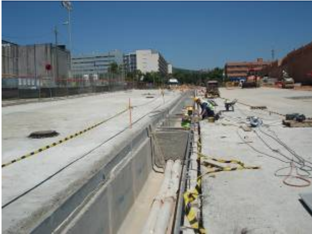
Col·locació de xapa sobre rasa drenant (29/05/09)