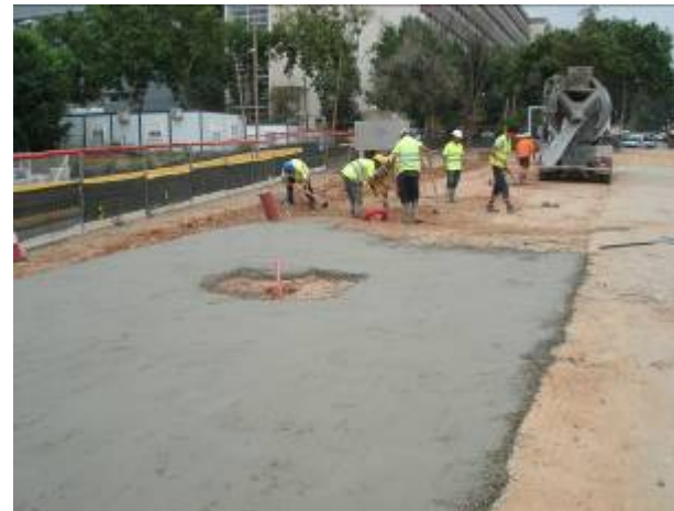
Formigonat al costat Pau Gargallo (16/04/09)