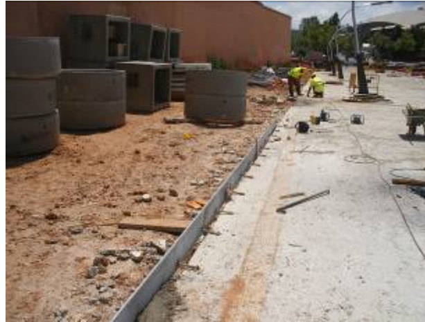
Treballs al costat cementiri (14/07/09)