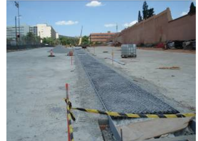
Col·locació de la cel·la drenant (09/06/09)